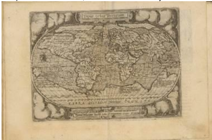
Figura 5. Theatri Orbis Terrarum Enchiridion. Philippe Galle; Abraham Ortelius, 1585.

geográficas del momento. Entre 1577 y mediados del siglo XVII se publicaron diversas versiones resumidas y en formato reducido de los más famosos atlas del momento (por ejemplo, el propio Theatrum de Ortelius bajo el título de Epitome o Enchiridion , o el Atlas de Mercator y Hondius con el título de Atlas Minor ).