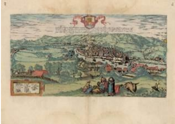
Figura 8. Bilbao, en Civitates Orbis Terrarum. Georg Braun; Franz Hogenberg, 1575.

En esta sección se incluyen vistas topográficas de varias ciudades y lugares de España.