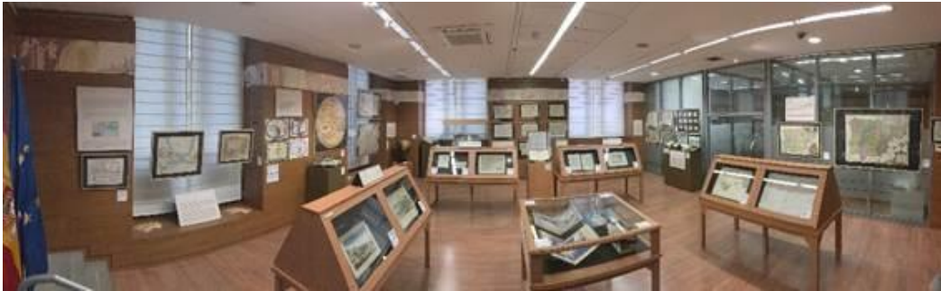
Figura 2. Panorámica de la sala de exposiciones del IGN.

La sala de exposiciones es de reducido tamaño, con una superficie de 80m 2 , por lo que se hace imprescindible realizar una selección exhaustiva de las obras a exponer, ya sea por su relevancia histórica o su interés artístico o socio-cultural, de tal manera que abarque todo el periodo del cual estamos tratando y sea lo más representativo de cada una de las secciones que queremos resaltar. La cartografía y la documentación se distribuye en diferentes tipos de vitrinas, urnas, marcos, etc., con el fin de mostrar al visitante las obras de la mejor manera posible y cuidando su conservación.