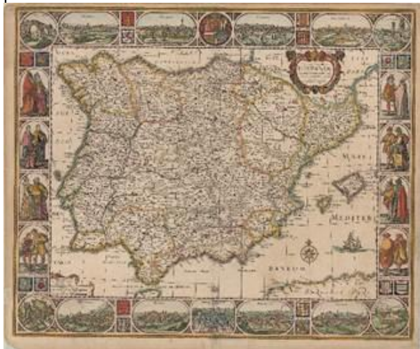
Figura 6. Nova et accurata Tabula Hispaniae. Johannis Visscher, 1623.

Willen Janszoon, el creador de la firma Blaeu, fue uno de los primeros editores que publicaron mapas con orlas decorativas compuestas por figuras de personajes ataviados con trajes de la época y por planos y vistas de ciudades procedentes del Civitates . En esta sección se muestran varios de estos mapas orlados.