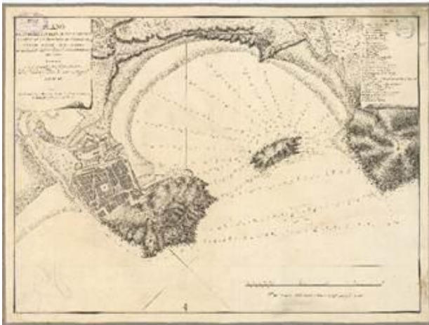
Figura 7. Plano de la Plaza y Puerto de San Sebastián, en Atlas Marítimo de España. Vicente Tofiño, 1788.

Predominan las obras de cartografía francesa del siglo XVIII. En esta sección se encuentra una de las cartas náuticas del Atlas Marítimo de España de Vicente Tofiño, pionero en la medición de las costas con métodos astronómicos.