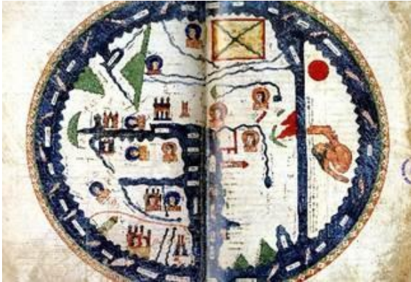
Figura 3. Mapamundi del Beato del Burgo de Osma. Beato de Liébana; monjes Pedro y Martino, 1086.

A finales del siglo VIII, Beato de Liébana, un monje beneditino español, elaboró el "Comentario del Apocalipsis" en el monasterio de San Martín de Turieno (Santo Toribio de Liébana). A pesar de que la obra no nos ha llegado en su estado original, es conocida por las numerosas copias que se hicieron en los siglos posteriores. Los Beatos son ensalzados por sus expresivas ilustraciones, entre las que destaca la imagen del mapamundi que representa el mundo al que fueron enviados los apóstoles para evangelizar. Esta imagen cristiana del mundo experimentó una evolución a medida que el manuscrito se fue copiando y editando entre los siglos X y XIII. Actualmente se conservan catorce mapamundis a las que se pueden sumar otras copias cartográficas derivadas o emparentadas con ellos. En estos mapas, de T en O, aparecen Europa, África, Asia y un cuarto continente denominado Terra incógnita de los antípodas. En estos Beatos, orientados al Este, figuran tanto la península ibérica como las islas Afortunadas (Canarias), inmersas en ese Océano que en la mentalidad medieval rodeaba el mundo. (Sáenz-López, 2014)