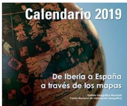
Figura 10. Calendario 2019. "De Iberia a España a través de los mapas". Fuente: Instituto Geográfico Nacional y Centro Nacional de Información Geográfica. .

Ambos, tanto el catálogo como el calendario, se pueden adquirir de forma impresa en la Casa del Mapa del IGN o a través de la tienda virtual ( https://www.cnig.es/ ).