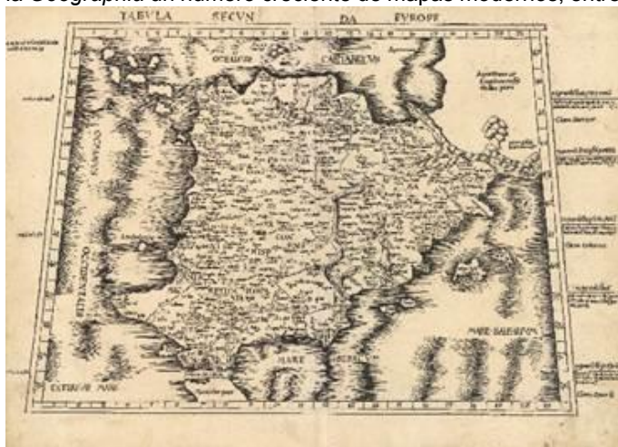
Figura 4. Tabula Secunda Europe. Martin Waldseemüller, 1513.

Aunque la Geographia de Ptolomeo fue adoptada como doctrina cartográfica oficial en los círculos renacentistas desde su traducción al latín en 1406, pronto empezaron a observarse discrepancias importantes entre los mapas ptolemaicos y la información geográfica conocida a partir de fuentes más actuales. Así surgieron las llamadas tabulae modernae o novae (mapas modernos o nuevos), que delineaban de manera más acorde a la realidad algunos de los mapas de Ptolomeo, conforme a la información más reciente procedente, en gran medida, de las cartas portulanas utilizadas para navegar por el Mediterráneo. Desde 1466 se empezó a incluir de forma habitual en la Geographia un número creciente de mapas modernos, entre los que siempre figuró el de la península ibérica.